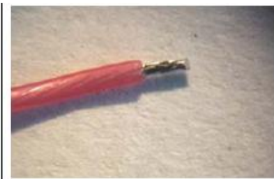
Рис.2 Подготовка кабеля