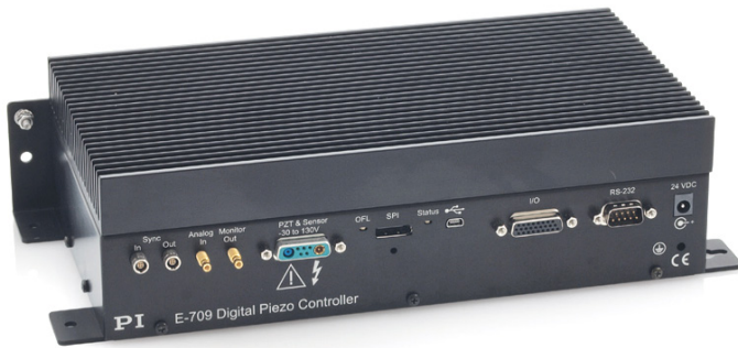
Внешний вид контроллера E-709.CHG

Контроллер E-709.CHG является одноканальными и предназначен для управления пьезоактуаторами и пьезоплатформами с ёмкостным датчиком обратной связи.